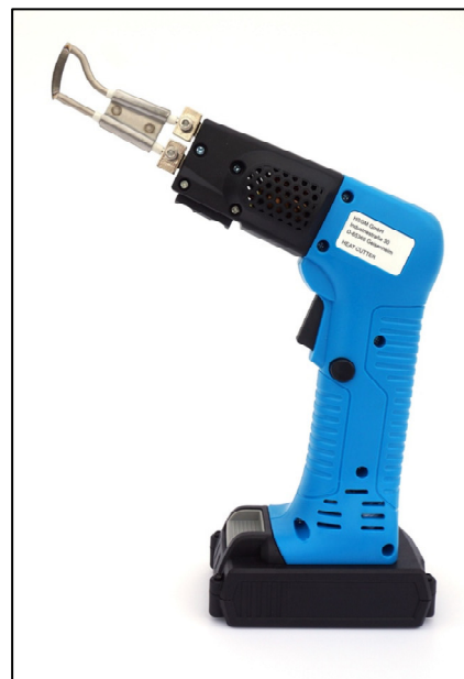
HSG-0-Accu avec pointe de coupe Type R-Accu

1x HSG-0-Accu 1x Clé d'Allen 1x Batterie Li-Ion 18 V 2.0 Ah 1x Brosse en laiton 1x Chargeur pour HSG-0-Accu 1x Boîtier d'équipement 1x Pointe de coupe Type R-Accu 1x Manuel d'instructions avec déclaration de conformité